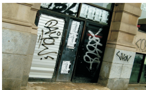
Klotter / "Tags"